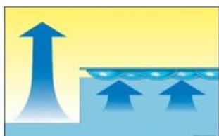
Control de la evaporación